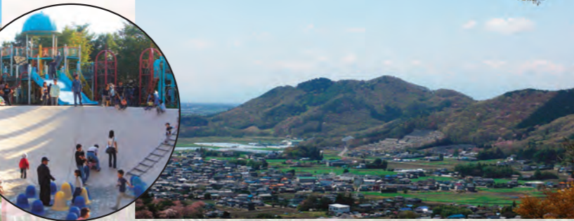
⑮みかも山公園 三義山(日本花の百名山・関東の富士見百景)

フラワートレイン(乗物)のみ火曜日運休(祝日の場合は翌日運休) 栃木市岩舟町下津原1747-1 ☎0282-55-7272 山の上の展望ランド。万葉集にも詠まれた三義山全体を利用した栃木県最大の都市公園でカタクリ、ニリンソウ等が植生。自然散策路が整備され、ウォーキング派にも花見派にも、家族みんなで楽しめる。わんぱく広場、冒険の森、ハーブ園もあります。