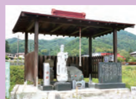
③小野小町の墓 (伝説)

栃木市岩舟町下津原1457 ☎0282-55-2505 慈覚大師円仁ゆかりの寺として、面相智水や行ノ井等があります。