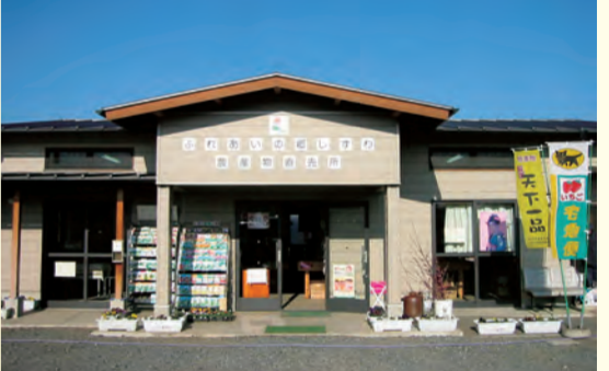
24 ふれあいの郷しずわ農産物直売所 岩舟町静戸498-7 TEL0282-55-3150 定休日/水曜日 9:00~17:00(季節により変動) 国道50号沿い、静戸中央交差点近くにある農産物直売所。地元農家で採れた新鮮野菜と果物、花、味噌、生そば・生うどん、ジャムなどを販売。