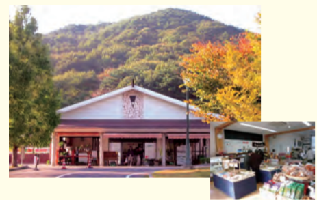
16 みかも山岩舟特産館 栃木市岩舟町下津原1747-1 TEL0282-55-5885 定休日/火曜日(祝日の場合は翌日休み) 商工業のアンテナショップ。観光の必須スポットとしてみかも焼・地酒・漬物・菓子・みかも餃子・オリヅルソース等の岩舟特産品を取り揃えてお待ちしております。