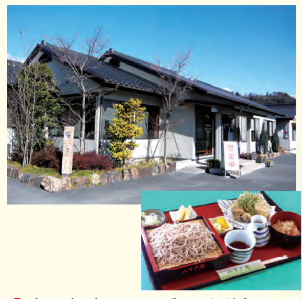
5 小野寺 山里のそば みすぎ庵 栃木市岩舟町小野寺1508 TEL0282-57-7777 定休日/火曜日(祝日は翌日休み)

栃木市岩舟町は、自然と歴史に恵まれた風光明媚なまちです。とちぎ花センター、みかも山公園、岩船山など、なだらかな丘陵をなした公園があり四季おりおりの風景が楽しめます。また、慈覚大師円仁誕生地、東山道など数多くの史跡が点在するほか、ぶどう、梨、いちごなどの特産物にも恵まれた地域です。