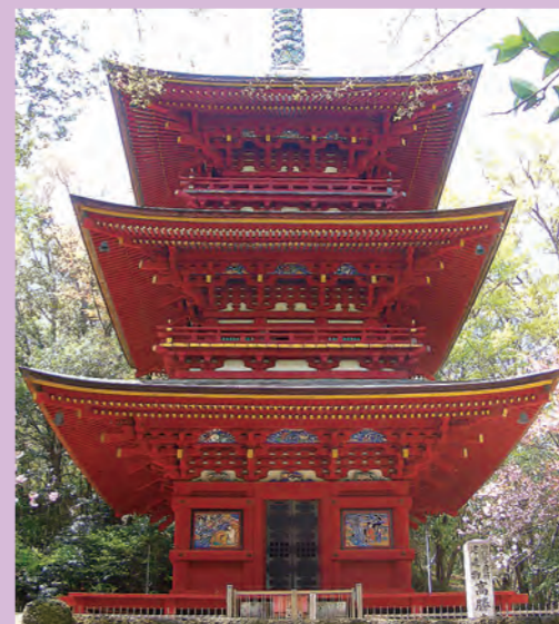
三重塔 (県指定文化財)