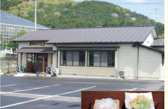
17 そば処 円仁庵 栃木市岩舟町下津原1612-3 TEL0282-55-7760 定休日/月曜日(祝日は翌日休み)