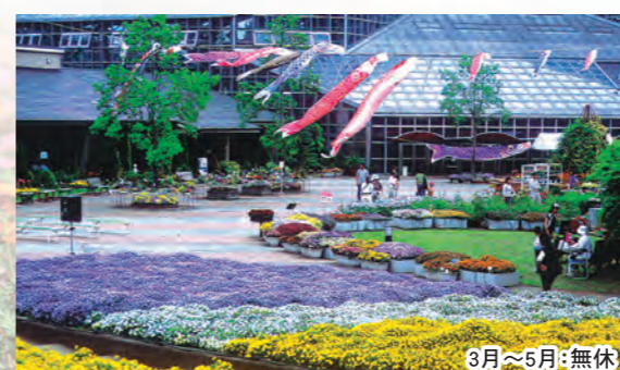
⑭とちぎ花センター 定休日/月曜日(祝日の場合は翌日休み)

フラワートレイン(乗物)のみ火曜日運休(祝日の場合は翌日運休) 栃木市岩舟町下津原1747-1 ☎0282-55-7272 山の上の展望ランド。万葉集にも詠まれた三義山全体を利用した栃木県最大の都市公園でカタクリ、ニリンソウ等が植生。自然散策路が整備され、ウォーキング派にも花見派にも、家族みんなで楽しめる。わんぱく広場、冒険の森、ハーブ園もあります。