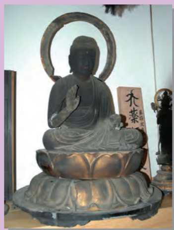
③瀧水寺 薬師如来坐像 (県指定文化財)