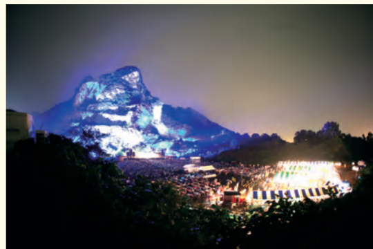
岩船山クリフステージ 事務局：栃木市岩舟町藤葉54 TEL0282-55-6988 岩舟町のシンボル岩船山を舞台に、かつて岩舟石が採掘された山にできた80mの崖(クリフ)を背景にコンサートを開催。自然の音響効果と産業遺産をエンタテイメントに活かした開放感にあふれ、幻想的な雰囲気を楽しめるステージです。 http://www.cliff-stage.com