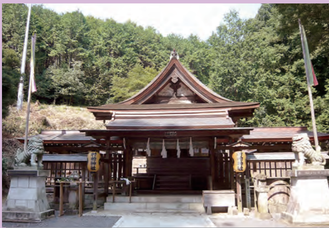
①村檜神社 (国指定重要文化財)

栃木市岩舟町小野寺2255 ☎0282-57-7801 7285 (社務所) 本殿は三間社春日造で、屋根は檜皮葺です。参道の杉は樹齢1000年にも及ぶと言われています。ハイキング道路が整備され、見晴らし台からの眺めは格別です。