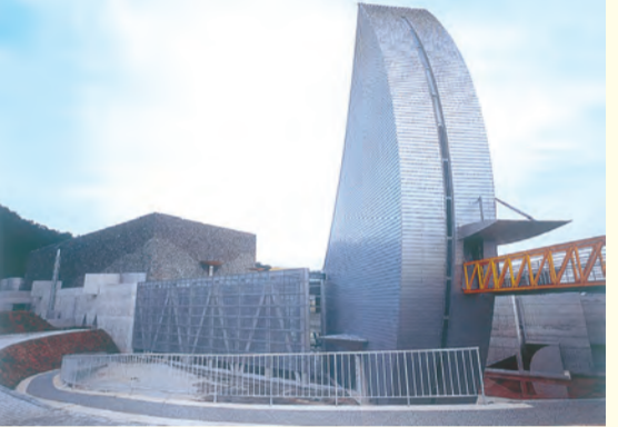
21 コスモスホール(岩舟文化会館) 栃木市岩舟町静2303 TEL0282-55-7055 岩舟町のシンボルとなるコスモスホールは、慈覚大師円仁が中国に渡った遣唐使船をイメージしたデザインで建築され、クラシックコンサートなど多種多様なイベントが開催されています。