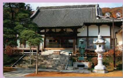
⑬高平寺 (栃木市指定文化財)

栃木市岩舟町下津原1457 ☎0282-55-2505 慈覚大師円仁ゆかりの寺として、面相智水や行ノ井等があります。