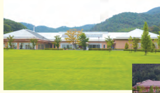
9 遊楽々館・岩舟総合運動公園 栃木市岩舟町三谷1038-1 TEL0282-54-3331 健康福祉センター。浴室の他にもミストサウナ完備。お風呂上がりは大広間や、静養室でのんびりくつろげる。