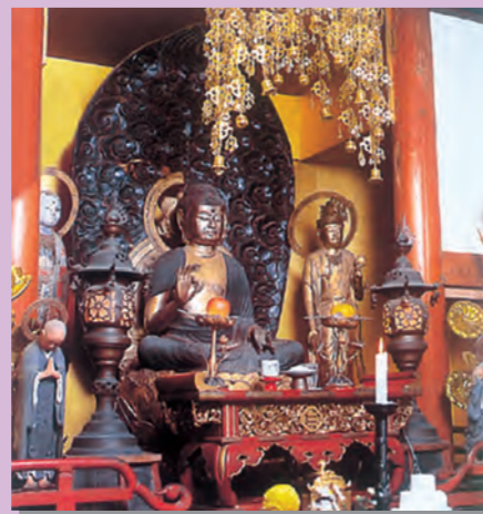
⑥住林寺 阿弥陀如来坐像 (県指定文化財)

栃木市岩舟町小野寺2255 ☎0282-57-7801 7285 (社務所) 本殿は三間社春日造で、屋根は檜皮葺です。参道の杉は樹齢1000年にも及ぶと言われています。ハイキング道路が整備され、見晴らし台からの眺めは格別です。