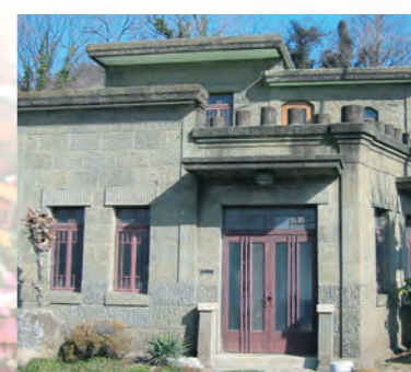
⑪岩舟石の資料館(休館日/月曜日)

3月~10月▶AM9:00~PM5:00 11月~2月▶AM9:00~PM4:30 栃木市岩舟町下津原1612 ☎0282-55-5775 花と緑につつまれた安らぎの空間。花びらをイメージした大花壇の花たちがお出迎え。鑑賞温室は、約1,200種の植物が咲いています。また、季節に合わせた花の企画展やイベント、体験教室や各種園芸講座を開催しています。さらに、栃木県産の高品質で豊富な品揃えの花の販売所などもあります。