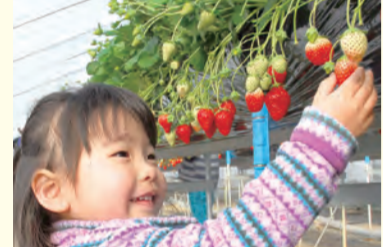
18 いわふねフルーツパーク 栃木市岩舟町下津原1585 TEL0282-55-5008 定休日/月曜日(祝日の場合は翌日休み) いちご狩りをはじめ、ぶどう狩り、ブルーベリー狩りの体験が楽しめます。