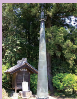
②大慈寺相輪椽 (県指定文化財)

栃木市岩舟町小野寺2247 ☎0282-57-7286 平安時代随一の学僧といわれる慈覚大師円仁が9歳から6年間修行したこの寺には、聖観音菩薩坐像をはじめ、相輪椽や華鬘など、多くの文化財が保存されています。