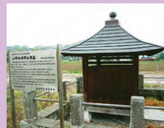
⑦小野寺禅師太郎通綱の墓

(栃木市指定文化財) 栃木市岩舟町小野寺640 小野寺城主となった通綱の墓があります。