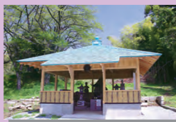
⑧慈覚大師御母公の墓

栃木市岩舟町下津原1198 慈覚大師円仁はここで生まれ、産湯をつかったと伝えられる古戸があります。