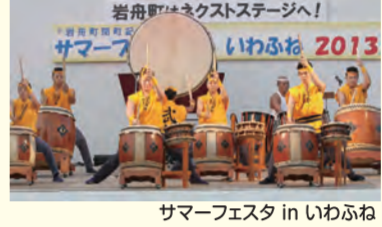
サマーフェスタ in いわふね