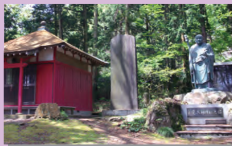
⑫慈覚大師誕生地 (栃木市指定文化財)

栃木市岩舟町下津原1198 慈覚大師円仁はここで生まれ、産湯をつかったと伝えられる古戸があります。