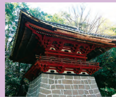
⑬鐘楼 (県指定文化財)