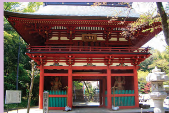
山門 (県指定文化財)

いわふねさん こうしょうじ 栃木市岩舟町静3 ☎0282-55-2014 岩肌を出した岩船山山頂に建てられ、かつては関東の高野山とよばれ一大霊場として栄えました。また、子授・子育て・安産の地藏信仰としても有名で春・秋彼岸には、参拝者が多く訪れます。